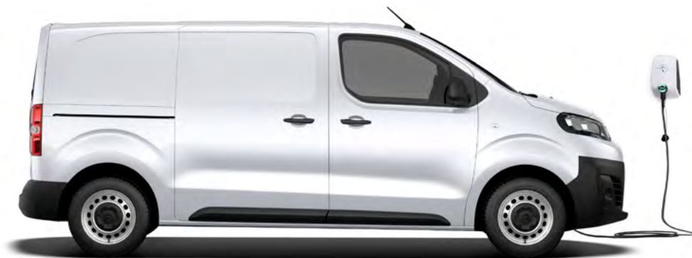
Dobíjanie striedavým prúdom pomocou WALLBOX-u.