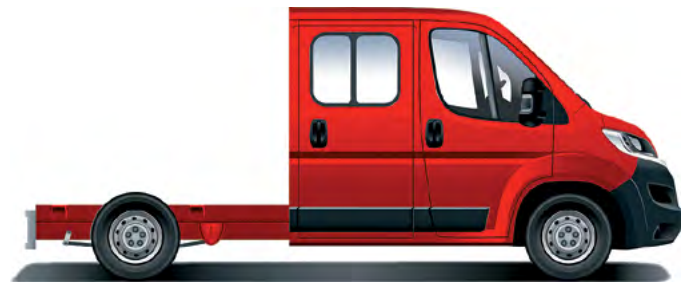
Citroën Jumper Šasi – dvojitá kabína.

Ďalšie informácie o vozidle nájdete na stránke www.citroen.sk , alebo sa obráťte na vášho najbližšieho predajcu CITROËN. C Automobil Import, s. r. o., si vyhradzuje právo meniť ceny a výbavu vozidiel bez predchádzajúceho upozornenia. Obrázok vozidla je ilustračný. Všetky ceny uvádzané v akciovom cenníku sú platné v prípade registrácie vozidla kupujúcim v členských štátoch Európskej únie (EU), štátoch Európskeho hospodárskeho priestoru (EHP) a vo Švajčiarsku, ktorú kupujúci riadne preukáže predávajúcemu predložením kópie príslušného osvedčenia o evidencii vozidla najneskôr v posledný deň kalendárneho mesiaca, v ktorom bolo vozidlo prevzaté zákazníkom. V prípade nesplnenia uvedených podmienok platia ceny a príplatky uvádzané v základnom cenníku. Použitie akciového cenníka je vylúčené aj v prípade špekulatívneho konania, najmä účelovej registrácie alebo zmeny registrácie vozidla. Viac informácií poskytnete autorizovaný predajca na vyžiadanie.