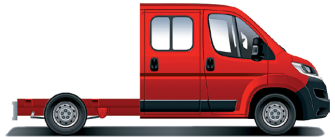
Citroën Jumper Šasi – dvojitá kabína.

Ďalšie informácie o vozidle nájdete na stránke www.citroen.sk , alebo sa obráťte na vášho najbližšieho predajcu CITROËN. C Automobil Import, s. r. o., si vyhradzuje právo meniť ceny a výbavu vozidiel bez predchádzajúceho upozornenia. Obrázok vozidla je ilustračný. Všetky ceny uvádzané v akciovom cenníku sú platné v prípade registrácie vozidla kupujúcim v členských štátoch Európskej únie (EU), štátoch Európskeho hospodárskeho priestoru (EHP) a vo Švajčiarsku, ktorú kupujúci riadne preukáže predávajúcemu predložením kópie príslušného osvedčenia o evidencii vozidla najneskôr v posledný deň kalendárneho mesiaca, v ktorom bolo vozidlo prevzaté zákazníkom. V prípade nesplnenia uvedených podmienok platia ceny a príplatky uvádzané v základnom cenníku. Použitie akciového cenníka je vylúčené aj v prípade špekulatívneho konania, najmä účelovej registrácie alebo zmeny registrácie vozidla. Viac informácií poskytneme autorizovaný predajca na vyžiadanie.