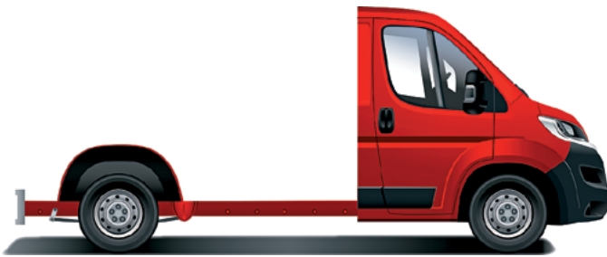
Citroën Jumper Šasi – jednoduchá kabína.