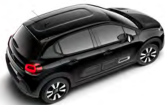
Čierna PERLA NOIR