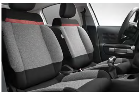
Sedadlá so sivým čalúnením C-SERIES s červeným prvkom