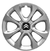
Okrasný kryt ARROW 15"