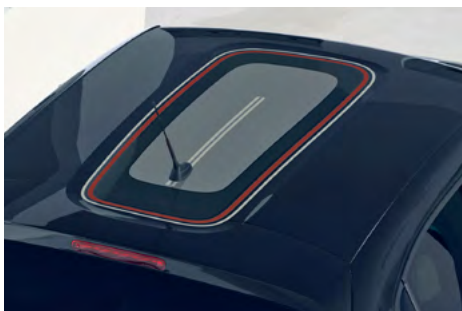
Nálepka na streche v štýle C-SERIES