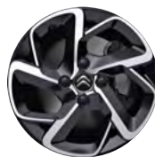
Disk BITON HELLIX 16"