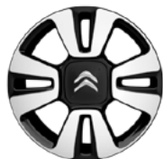
Disk MATRIX 16"