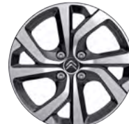
Disk VECTOR 17"