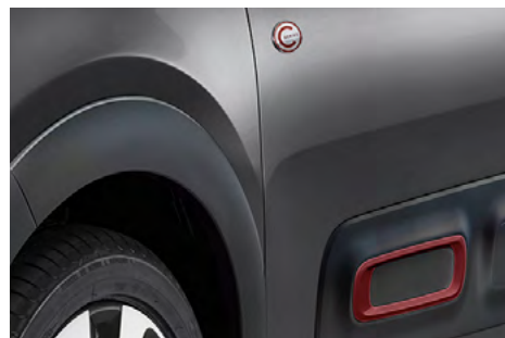
Červený prvok na Airbumpce