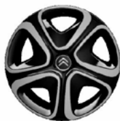
Okrasný kryt 3D 16"