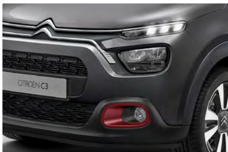
Orámovanie hmlových svetlomety v červenej farbe REGAL RED.