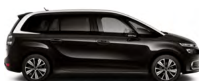
ČIERNA PERLA NERA (M)