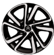
DISK KOLIES Z ĽAHKEJ ZLIATINY 17" SHAMAL