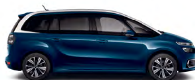
ALCHEMY MODRÁ (M)