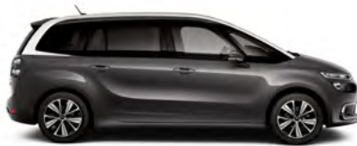
SIVÁ PLATINIUM (M)