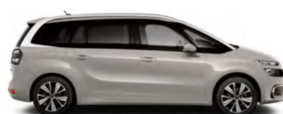
BÉŽOVÁ SABLE (M)