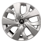
DISK KOLIES Z ĽAHKEJ ZLIATINY 16" NOTOS