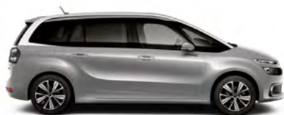
SIVÁ ARTENSE (M)