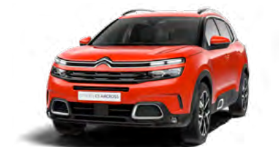
Pack Color Silver (strieboená)