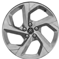
Disk z ľahkej zliatiny SWIRL, 18"