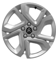
Disk z ľahkej zliatiny ELLIPSE, 17"