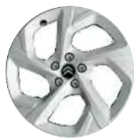
Disk z ľahkej zliatiny SWIRL, 18"