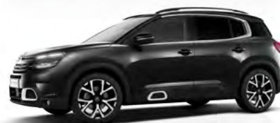
Čierna Perla Nera (M)