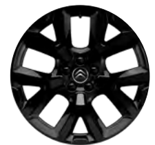
Disk z ľahkej zliatiny ART ČIERNY, 19"

• Štandardná výbava / - nedá sa objednať / (1) – Šírka vozidla, šírka vozidla so sklopenými spätnými zrkadlami; (2) – S pozdĺžnymi tyčami; (3) – Rezervné koleso je potrebné objednať ako príslušenstvo. Cena rezervného kolesa je orientačná a môže sa meniť v závislosti od objednaných dielov k samotnému rezervnému kolesu. Presný rozpis dielov dodávaných s rezervným kolesom a iných detailov Vám poskytne predajca. Pre viac informácií o obsahu servisného kontraktu, ako aj o možnostiach inej kombinácie dĺžky kontraktu a najazdených kilometrov, kontaktujte ktoréhokoľvek predajcu CITROËN, alebo kliknite na www.citroen.sk .