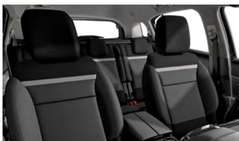
Látka SILICA sivá (v sérii pre FEEL)