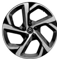
Disk z ľahkej zliatiny SWIRL diamantée, 18"