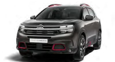
Pack Color Deep Red (červená)