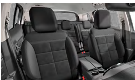
Mix ALCANTARA čierna + látka (TEP) čierna / interiér Urban Black