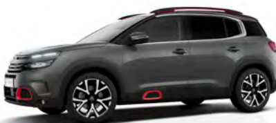
Sivá Platinum (M)