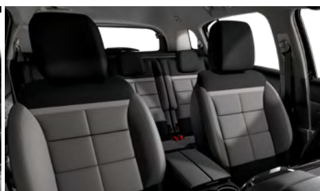
Mix koža GRAINE – grafitová látka / METROPOLITAN sivý