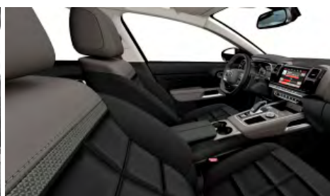
Mix koža NAPPA čierna – látka (TEP) sivá / interiér HYPE čierny