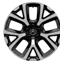
Disk z ľahkej zliatiny ART diamantée, 19"