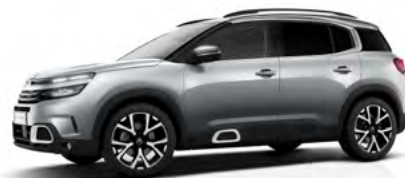
Sivá Artense (M)