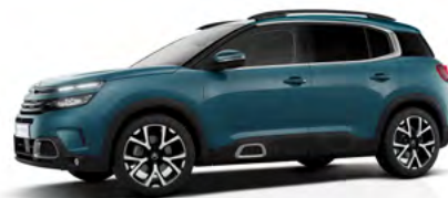
Modrá Tijuca (M)