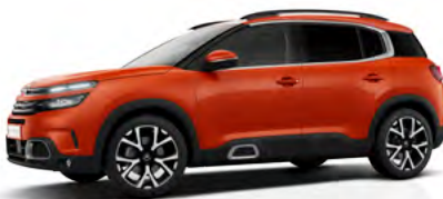
Červená Volcano (M)