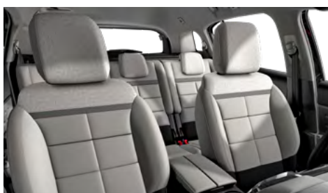
Mix koža GRAINE sivá – sivá látka / METROPOLITAN béžový