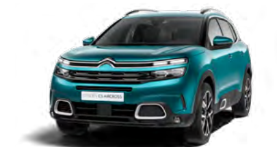
Pack Color White (biela)