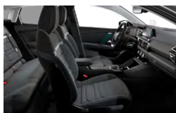
INTERIÉR URBAN GREY (V SÉRII PRE FEEL PACK)