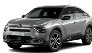
PACK COLOR TEXTURED GREY