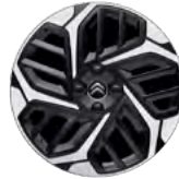
DISK Z LAHKEJ ZLIATINY 18" CAMELIA DIAMANTÉE