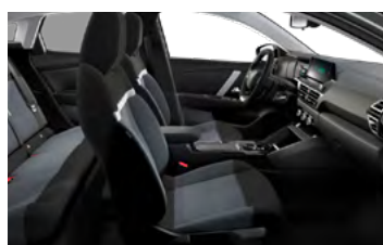
ŠTANDARDNÝ INTERIÉR (PRE LIVE PACK A FEEL)