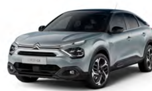
PACK COLOR VAPOR GREY