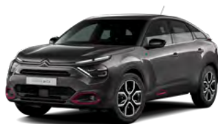
PACK COLOR ANODISED RED