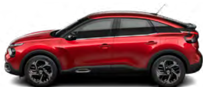
ČERVENÁ ELIXIR (P)

(M) – metalická farba karosérie, (P) – perletová farba