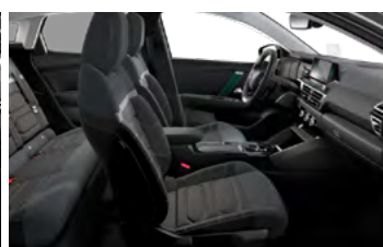
INTERIÉR METROPOLITAN GREY (V SÉRII PRE SHINE)