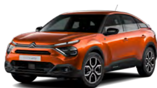
PACK COLOR GLOSSY BLACK