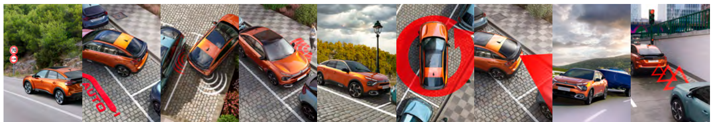
ČÍTANIE DOPRAVNÝCH ZNAČIEK A RÝCHLOSTNÝCH OBMEDZENÍ