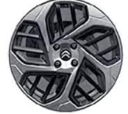
DISK Z LAHKEJ ZLIATINY 18" CAMELIA