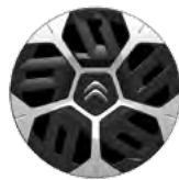
OKRASNÝ KRYT 18" AEROTHECH