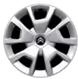
OKRASNÝ KRYT 16" SPRING