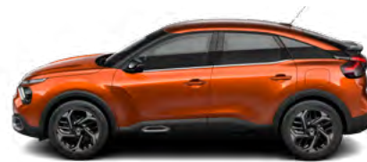
HNEDÁ CAMEL (M)