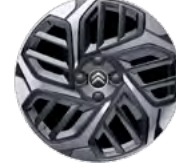
DISK Z LAHKEJ ZLIATINY 18" CAMELIA COLORÉE