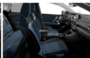
INTERIÉR METROPOLITAN BLUE