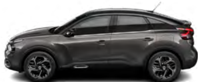
SIVÁ PLATINIUM (M)