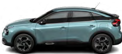
MODRÁ ICELAND (M)