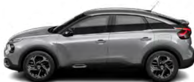
SIVÁ ARTENSE (M)