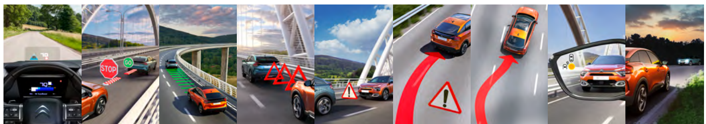
FAREBNÝ HEAD-UP DISPLEJ