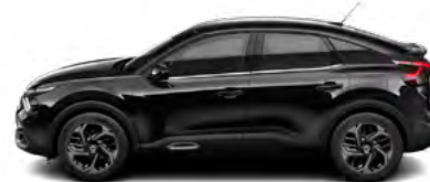
ČIERNÁ OBSIDIEN (M) / PERLA NERA (M)